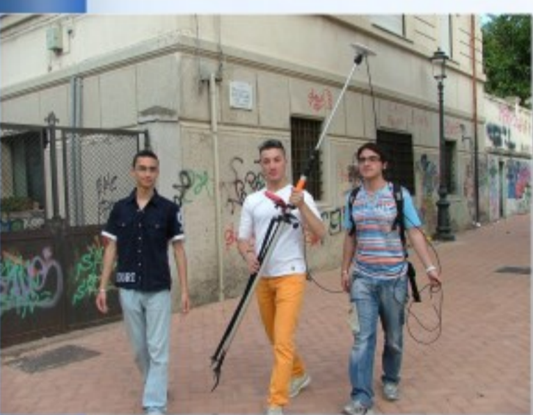
Poligonale topografica con i target utilizzati per le scansioni del laser scanner

Istituto Tecnico Statale per Geometri "A. Righi" - Reggio Calabria Concorso SIFET-MIUR 2006/2007